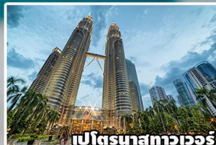
เปโตรนาสทาวเวอร์