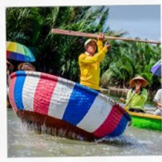
เรือกระดิง