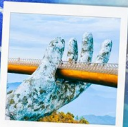
บาน่าฮิลล์