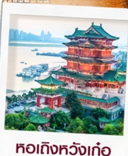
หอถึงหวงเก้อ