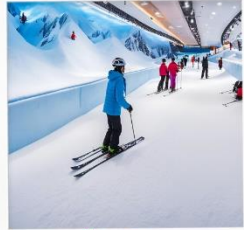
บ้านหิมะ WINDOW OF THE WORLD