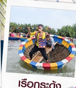
เรือกระด้ง