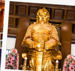
วัดเขากงหมิว