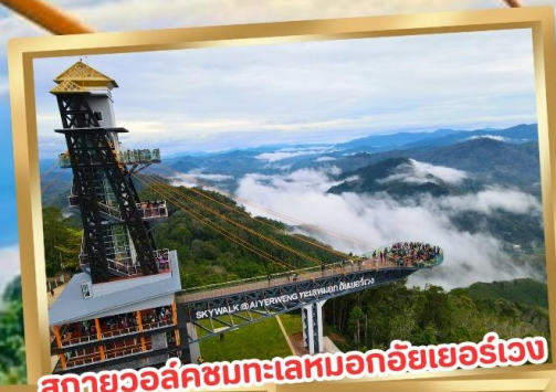
สกายวอล์คชมทะเลหมอกอัยเยอร์เวง

ร่วมโครงการ ลดหย่อนภาษี ลดสูงสุด 15,000.-