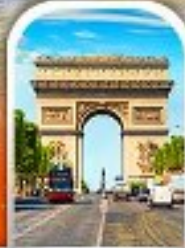
ARC DE TRIOMHE FRANCE