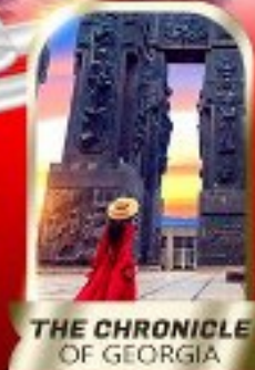
THE CHRONICLE OF GEORGIA