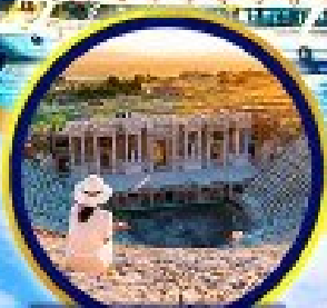
นครเฮลิโอส