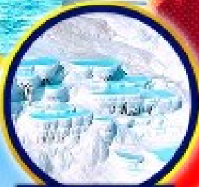
ปราสาทฟูยีฉ้าย