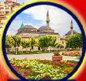
พิพิธภัณฑ์มัสลาม