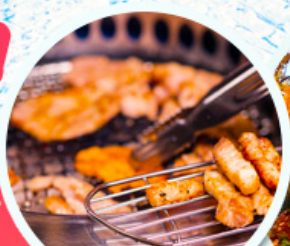
หมูย่างเกาหลี