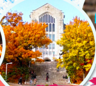
มหาวิทยาลัยอีฮวา