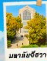
พิพิธภัณฑ์ชองวา