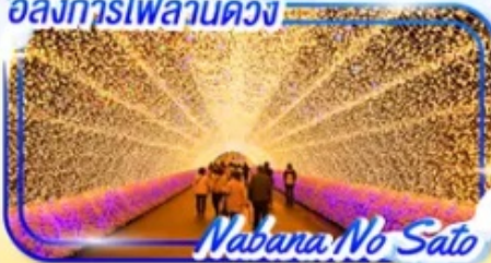
Nabana No Sato