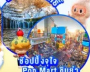
ช้อปปิ้งจ๊อ Pop Mart ชิบูย่า