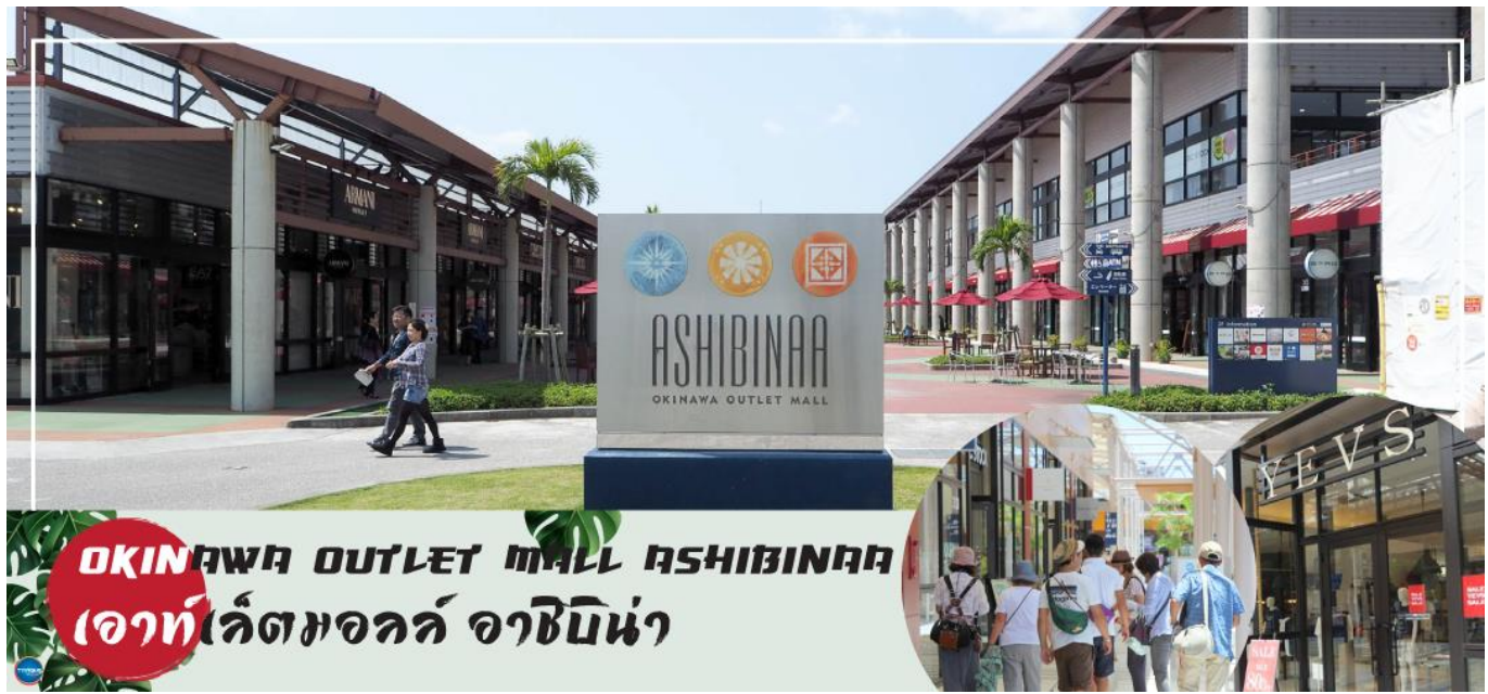
OKINAWA OUTLET MALL ASHIBINAA เอาท์เลตมอลล์ อาชิบิโน่า

เช้า รับประทานอาหารเช้า ณ ห้องอาหารของโรงแรม (5) นำท่านเดินทางสู่ ศาลเจ้านะมิโนะอุเอะ (Naminoue Shrine) (ใช้เวลาเดินทางประมาณ 10 นาที) ตั้งอยู่ ณ บริเวณที่เป็นพื้นที่ศักดิ์สิทธิ์ที่ใช้ในการสวดภาวนาอธิษฐานต่อเทพเจ้าที่สถิตย์อยู่ ณ อาณาจักรเจ้าสมุทรโพ้นทะเลมาแต่ครั้งโบราณ ในอดีตชาวเรือที่เข้าออก ณ ท่าเรือนาสะ (Naha Port) ซึ่งขณะนั้นเป็นศูนย์กลางการแลกเปลี่ยนค้าขายกับนานาประเทศ ทั้งจีน ประเทศทางตอนใต้ เกาหลี และชวายามาโตะ มักจะแหงนหน้ามองขึ้นไปยังศาลเจ้าซึ่งตั้งอยู่บนหน้าผาสูงเพื่ออธิษฐาน และแสดงความขอบคุณ ศาลเจ้านะมิโนะอุเอะได้รับความเสียหายจากการรบในโอกินาวะ (Battle of Okinawa) เมื่อครั้งสงครามแปซิฟิก แต่ได้รับการบูรณะฟื้นฟูในเวลาต่อมาเมื่อสงครามสิ้นสุดลง ปัจจุบันนี้ได้กลายมาเป็นศูนย์กลางแห่งศาสนาชินโตในจังหวัดโอกินาวะ ชาวญี่ปุ่นมักจะมาไหว้ขอพรเกี่ยวกับธุรกิจการงานให้เจริญรุ่งเรือง ร่ำรวย และมาสะเดาะเคราะห์ให้พ้นโชคร้าย จากนั้นนำท่านสู่ เอาท์เลตมอลล์ อาชิบิโน่า (Okinawa Outlet Mall Ashibinaa) (ใช้เวลาเดินทางประมาณ 30 นาที) เอาท์เลตแห่งแรกในโอกินาวะ รวบรวมร้านค้าชั้นนำกว่า 100 ร้าน ทั้งเสื้อผ้าแฟชั่น สินค้าแบรนด์เนม นาฬิกา ข้าวของเครื่องใช้ ของเล่น ทุกร้านจัดเต็มทั้งสินค้านำเข้าและรุ่นใหม่ ลดราคากระหน่ำกว่า 30-80% ให้ได้เดินช้อปปิ้งท้ายทวีปกันอย่างจุใจ ภายใต้บรรยากาศสบายๆ สไตล์รีสอร์ทริมทะเล หากช้อปปิ้งเหนื่อยสามารถขึ้นไปทานอาหารที่ชั้น 2 มีอีกหลายร้านที่คอยให้บริการ