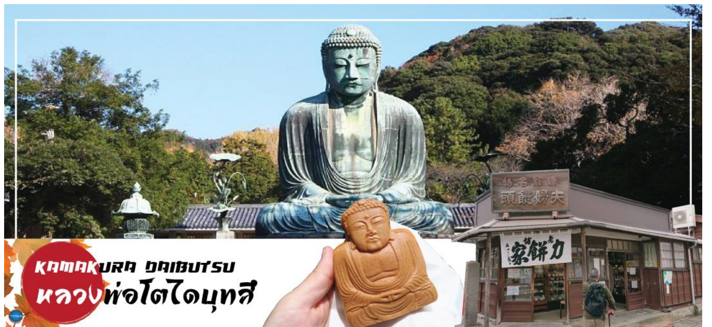
KAMAKURA DAIBUTSU หลวงพ่อโตไดบุทสึ

08.00 น. เดินทางถึง ท่าอากาศยานนานาชาตินาริตะ ประเทศญี่ปุ่น นำท่านผ่านขั้นตอนการตรวจคนเข้าเมืองและศุลกากร เรียบร้อยแล้ว (เวลาที่ญี่ปุ่น เร็วกว่าเมืองไทย 2 ชั่วโมง กรุณาปรับนาฬิกาของท่านเพื่อความสะดวกในการนัดหมายเวลา) ***สำคัญมาก!! ประเทศญี่ปุ่นไม่อนุญาตให้นำอาหารสด จำพวก เนื้อสัตว์ พืช ผัก ผลไม้ เข้าประเทศ หากฝ่าฝืนมีโทษปรับและจับ