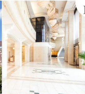
Marroad international Hotel Narita