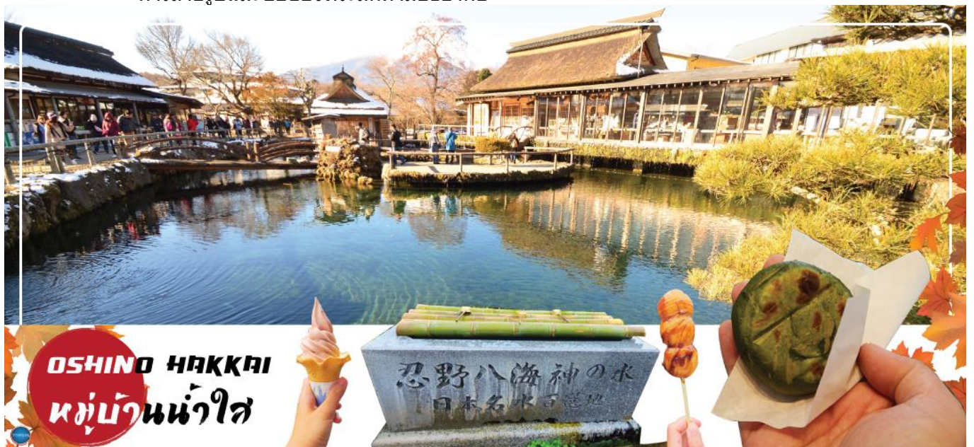
OSHINO HAKKAI หมู่บ้านน้ำใส

นำท่านชม หมู่บ้านโอชิโนะฮักไก (Oshino Hakkai) เป็นในช่วงฤดูใบไม้เปลี่ยนสีเป็นจุดท่องเที่ยวสำคัญอีกสถานที่หนึ่ง โดยมีวิวภูเขาไฟฟูจิสีขาวตัดกับพื้นหลังสีฟ้า และใบไม้เปลี่ยนสี สีเหลือง แดง ส้ม เป็นภาพที่สวยงามมาก โอชิโนะฮักไกเป็นหมู่บ้านเล็กๆ ประกอบด้วยบ่อน้ำ 8 บ่อในโอชิโนะ ตั้งอยู่ระหว่างทะเลสาบคาวากูจิโกะ กับทะเลสาบยามานาคาโกะ บ่อน้ำทั้ง 8 นี้เป็นน้ำจากหิมะที่ละลายในช่วงฤดูร้อน ที่ไหลมาจากทางลาดใกล้ภูเขาไฟฟูจิผ่านหินลาวาที่มีรูพรุนอายุกว่า 80 ปี ทำให้น้ำใสสะอาดเป็นพิเศษ นอกจากนี้ยังมีร้านอาหาร ร้านจำหน่ายของที่ระลึก และชมรอบๆบ่อที่ขายทั้งผัก ขนมหวาน ผักดอง งานฝีมือ และผลิตภัณฑ์ท้องถิ่นอื่นๆ อีสาระให้ท่านได้เพลิดเพลินกับการถ่ายรูปและซื้อของที่ระลึกตามอัธยาศัย