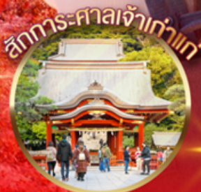
สักการะศาลเจ้าเก่าแก่