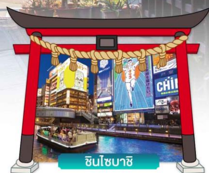
ชินโซบาชิจิ

เดินทางโดยสายการบินแอร์เอเชียเอ็กซ์ 🍴 อาหาร : 6 มื้อ 🏨 โรงแรม : 3 ดาว