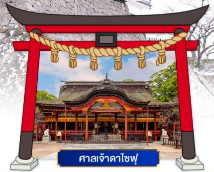
ศาลเจ้าคาโซฟู