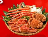
พิเศษ! ว่าง 3 ชนิด