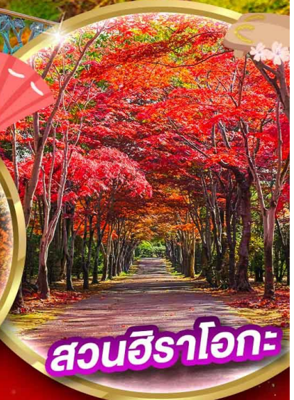
สวนชิราอิเกะ