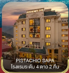
PISTACHIO SAPA โรงแรมระดับ 4 ดาว 2 คืน