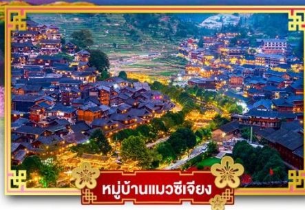
หมู่บ้านแม้วซีเจียง