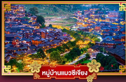
หมู่บ้านแมวซีเจียง