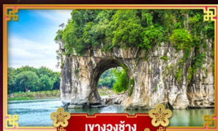
เวางวงซาง

"ใช้รถดินแดนแห่งขุนเขาและสายน้ำ นงกิงชิว"