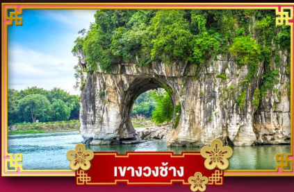
เขางวงช้าง

เที่ยวชมอุทยานซากุระหมีน้ำ "เซียนดินแดนแห่งขุนเขาและสาหร่ายน้ำ หางงิ้ว"