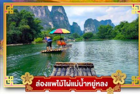
ล่องแพไม้ไผ่แม่น้ำหยูหลง