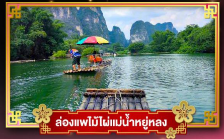
ล่องแพไม้ไผ่แม่น้ำหยูหลง