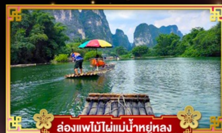
ล่องแพไม้ไผ่แม่น้ำหยูหลง