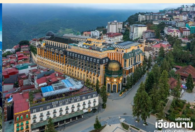
เม็คจอร์รี่ เวียดนาม ฮานอย • ซาปา • ฟานซิปัน • นิงห์บิ่งห์