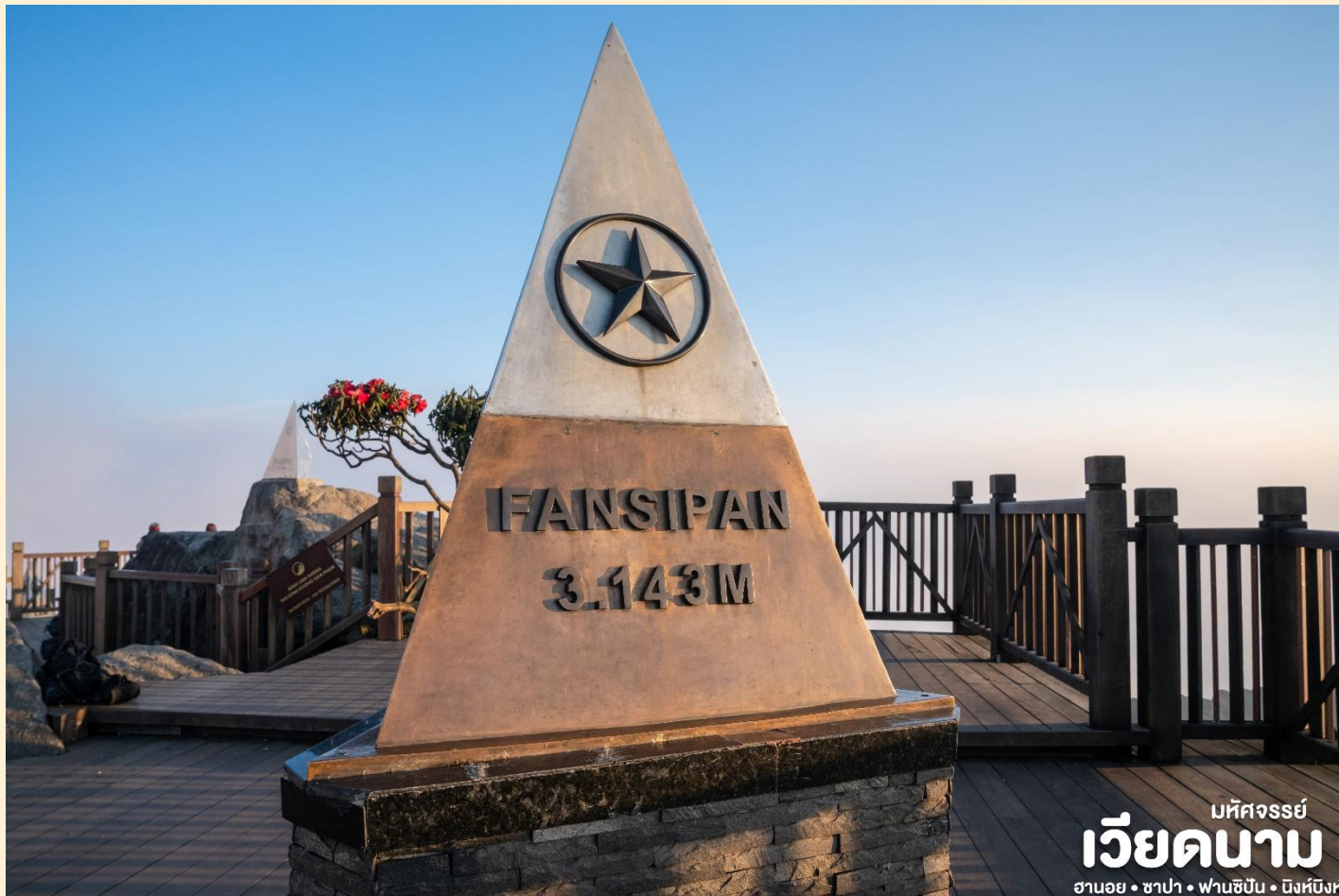
เม็คจอร์รี่ เวียดนาม ฮานอย • ซาปา • ฟานซิปัน • นิงห์บิ่งห์