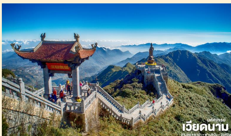
เม็คจอร์รี่ เวียดนาม ฮานอย • ซาปา • ฟานซิปัน • นิงห์บิ่งห์