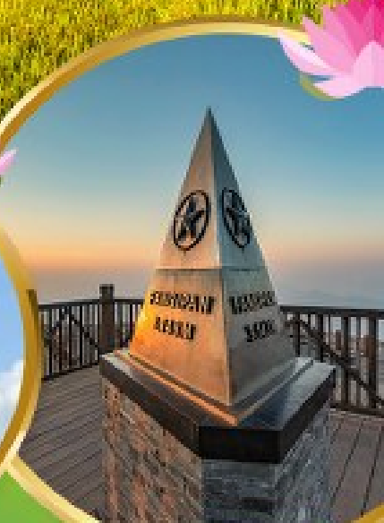
ฟานซีปัน