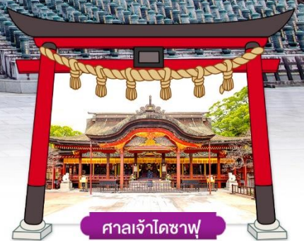
ศาลเจ้าโศซาฟุ