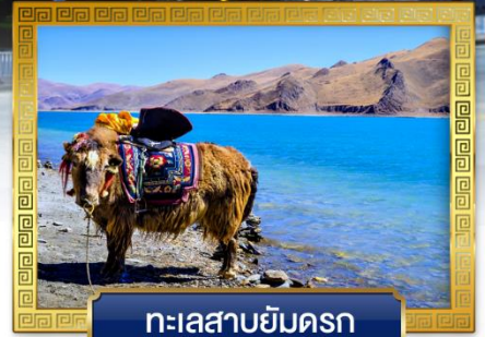
ทะเลสาบยัมดรก

เดินทางโดย: สายการบินลัคกี้แอร์ & ไซน่าอีสเทิร์นแอร์ไลน์