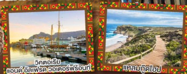
วิคตอเรีย แอนดอิลเฟรดวอเตอร์ฟรอนท์

เปิดประสบการณ์กับภัตตาคาร Canivore สวรรค์ของคนรักเนื้อสัตว์