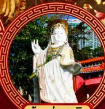
เจ้าแม่กวนอิม รีพัลส์เบย์