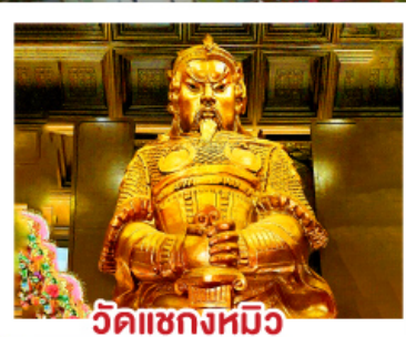
วัดแกลงหมี