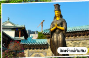
วัดเจ้าแม่กวน