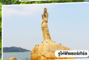
จูไห่พีซเซอร์เกิร์ล