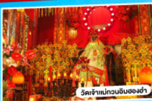
วัดเจ้าแม่กวนอิมของง่า

*นั่งรถข้ามสะพานเซ็นเจิ้น-จงซาน "สะพานข้ามทะเลที่สูงที่สุดในโลก"