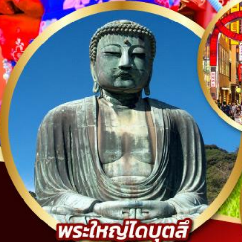
พระใหญ่ไดบุตสึ