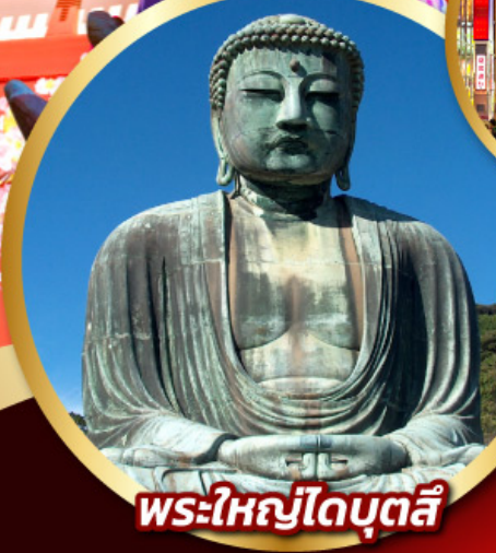
พระใหญ่ไดบุตสึ