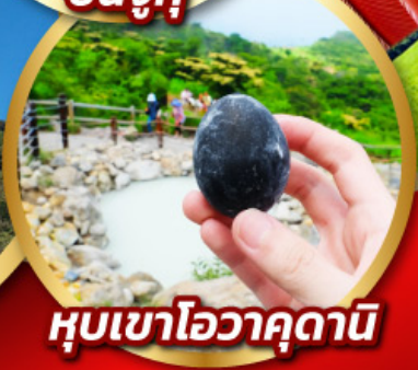
หุบเขาโอวาคุดานิ