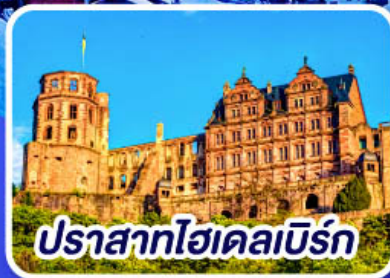
ปราสาทไฮเดลเบิร์ก