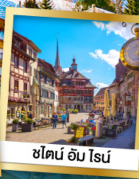
ชไตน์ อัม โรน์