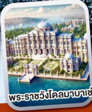
พระราชวังโดลมาบาเซ่