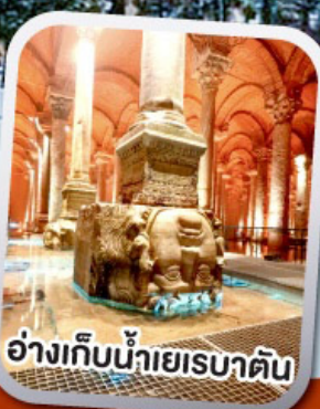
อ่างเก็บน้ำเยเรบาตัน