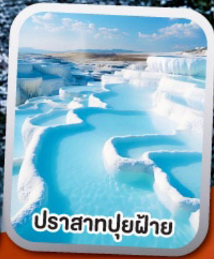
ปราสาทปุยฝ้าย