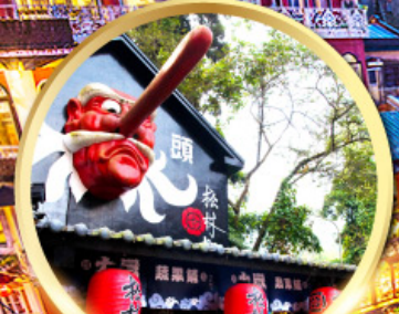
หมู่บ้านปิตาจซีโก