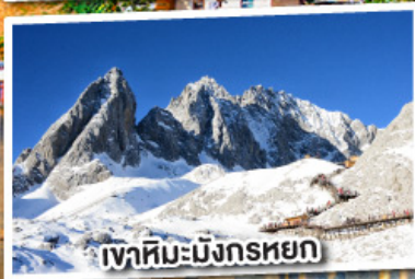
เขาสหิมะมังกรหยก