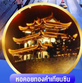
หอคอยทองคำเทียนซัน