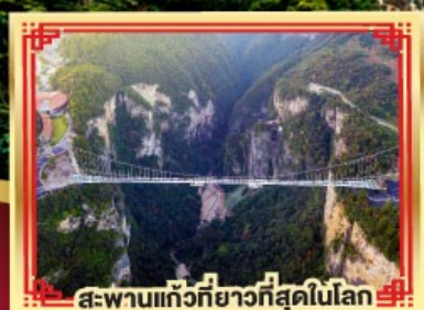
สะพานแกว่งที่ยาวที่สุดในโลก

เขาวงกต เกียนเหมินซาน สองเมืองโบราณ ฟูหลงเจิน เฟิ่งหวง