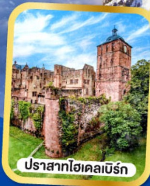
ปราสาทไฮเคิลเบิร์ก