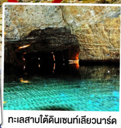
ทะเลสาบใต้ดินเซนท์เลียวนาร์ด

ล่องเรือชมทะเลสาบใต้ดินเซนท์เลียวนาร์ด ทะเลสาบใต้ดินลึกลับ สุดUnseenแห่งสวิตเซอร์แลนด์