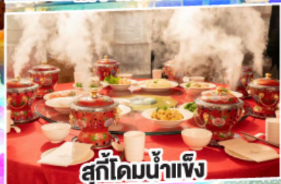
สุกี้ไต้มน้ำแข็ง