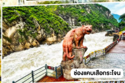
ช่องแคบเลิฮอร์โจน