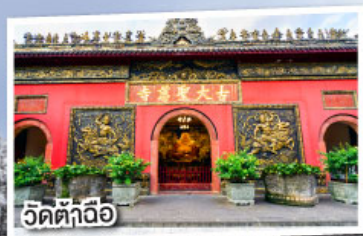
วัดต้าถื่อ