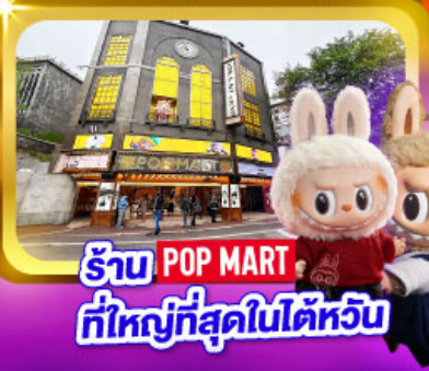
ร้าน POP MART ที่ใหญ่ที่สุดในไต้หวัน