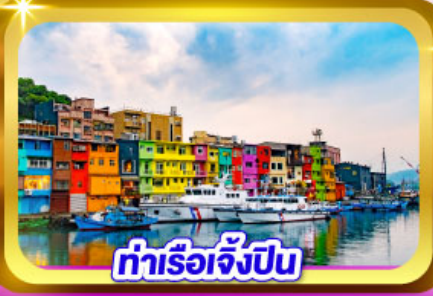
ท่าเรือเจิ้งปิง