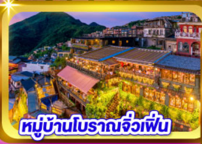
หมู่บ้านโบราณจิวเฟิน