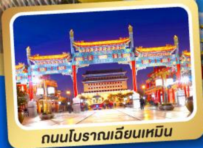
ถนนโบราณเฉียนเหมิน