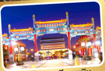
ถนนโบราณเทียนเหมิน