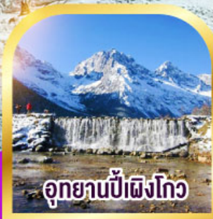
อุทยานป่าเผิงโกว