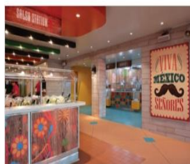
EL LOCO FRESH