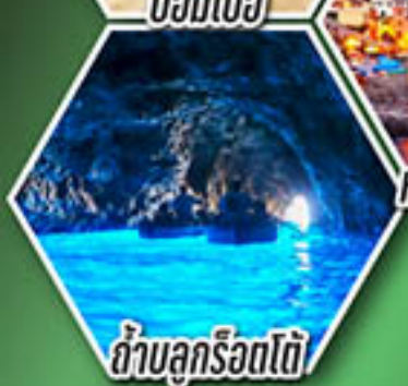
ถ้ำบลูกร็อตโต