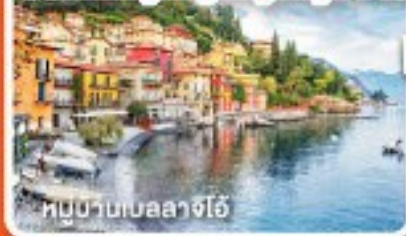
หมู่บ้านเบลลาจีโอ