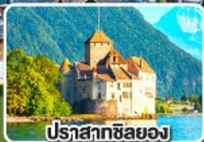
ปราสาทซิลยอง