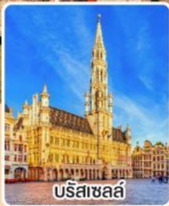
บริสเซลส์