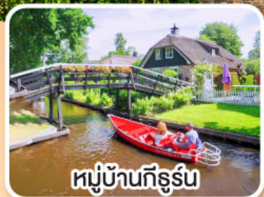
หมู่บ้านกังหัน