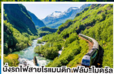
นั่งรถไฟสายโรแมนติกฟลัมโบโรคริส