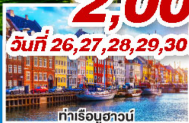
ท่าเรือฮาวน์

เดินทาง 19-26 พ.ย. 67 03-10 ธ.ค. 67 26 ธ.ค. 67-02 ม.ค. 68 (ปีใหม่)