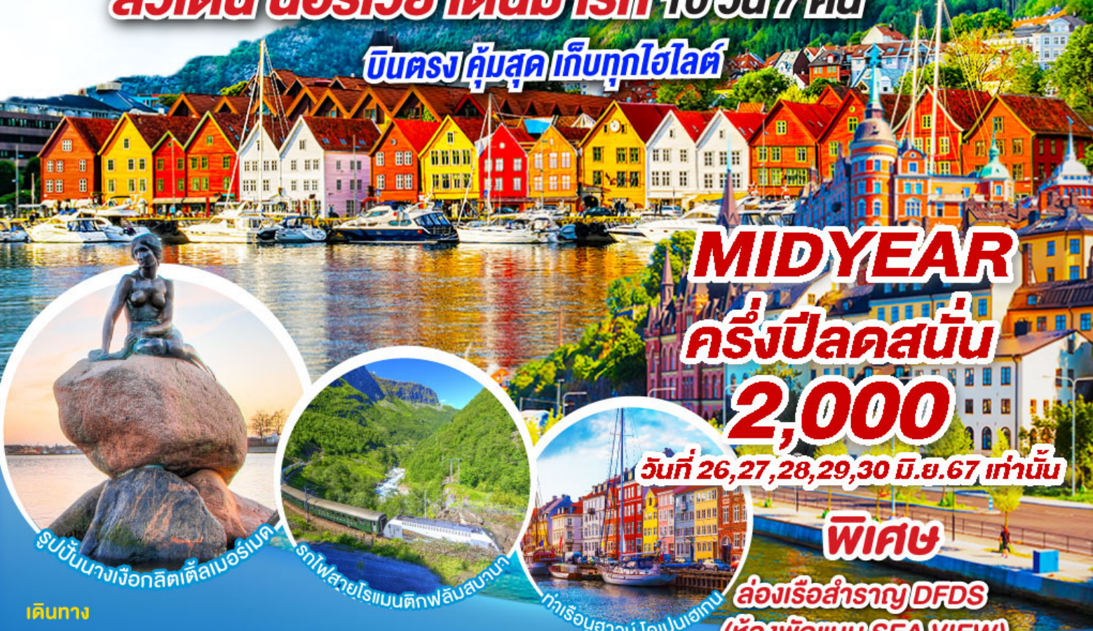
รูปปั้นนางเงือกลิตเติลเบออร์เนด